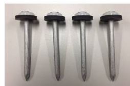
アスファルト路面施工専用釘