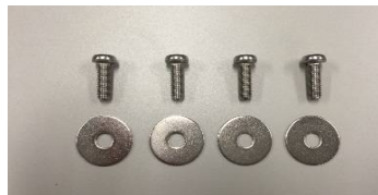
取付用 ネジ・ワッシャー